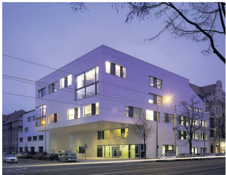
Strahlende Ecke: einer der Neubauten der Leipziger Hochschule

Mit Flachdach und glatten, dekorierten Fassaden präsentiert sich der Bau als Vertreter eines mit der „Zweiten Moderne“ wiederaufgekommenen geometrischen Minimalismus. Anstelle des bei Bauten dieser Observanz üblichen Sichtbetons zeigen die aus Großplatten gefügten weißen Außenmauern aber eine Hülle aus kleinteiligem Glasmosaik, die, je nach Sonnenstand, zwischen Matt und Schimmernd changiert. Die kubische Strenge wird auch durch die großen unre-